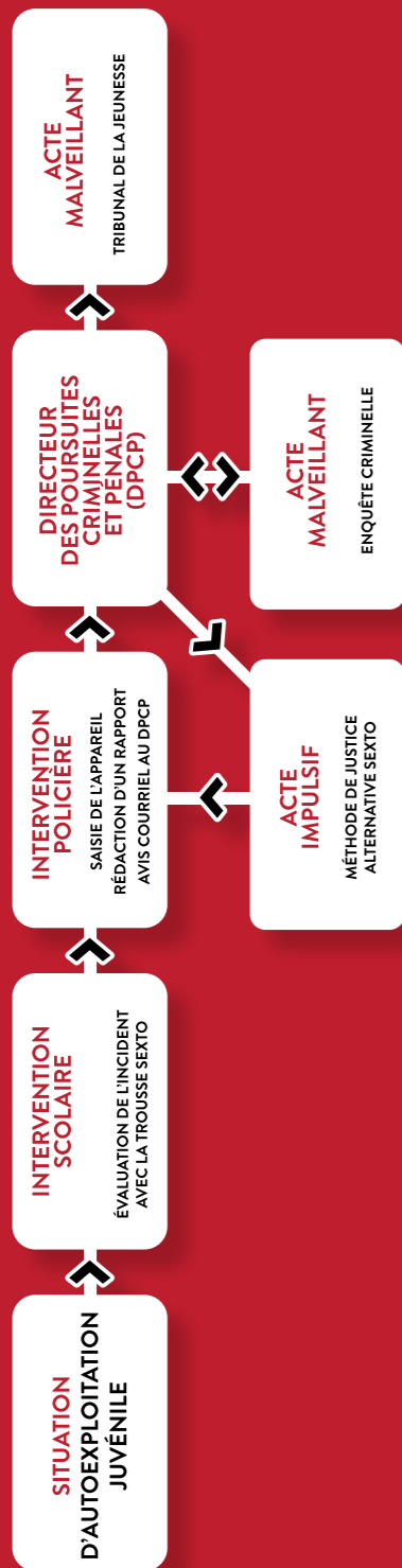
SCHÉMA D'INTERVENTION LORS D'UNE SITUATION D'AUTOEXPLOITATION JUVÉNILE DÉNONCÉE EN MILIEU SCOLAIRE

La méthode de justice alternative est une intervention éducative visant à informer les jeunes de la nature criminelle de leur comportement et de les sensibiliser aux conséquences importantes de l'autoexploitation juvénile. Elle est une mesure non judiciaire appliquée par le service de police pour une première offense dans 90% des cas (actes impulsifs). En cas de récidive ou de malveillance, une enquête criminelle sera privilégiée.